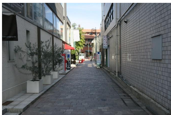
⑤ 石畳の床を真っすぐ進みます。 (突き当たりになる手前までそのまま歩いてきてください)