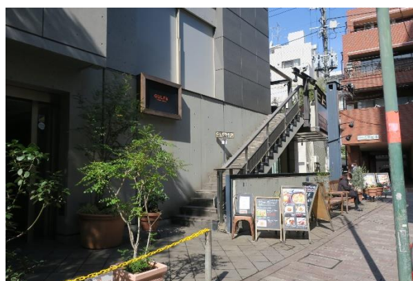
⑥ 左手に当店へあがる階段が見えます。 2階、GULF's transit table(ガルフストランジットテーブル)へ ご来店くださいませ。