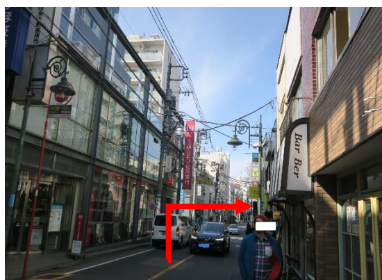
④ そのまま歩行者道路を右の通りに歩き、雑貨屋さんの 角を右に曲がります。(雑貨屋と服屋の間の細道を入ります) 曲がった道は、石畳の床になっております。