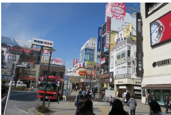
① 自由が丘駅 正面口改札を出て、 バスロータリーを左手にそのまま進みます。